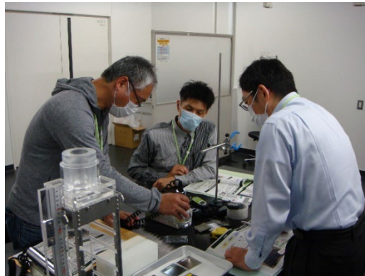
実習「放射線測定器の取り扱い」

現在原子力災害医療に関する研修は、基礎、専門、高度専門へとステップアップする研修体系（以下、「新研修体系」という。）のもと開催いたします。