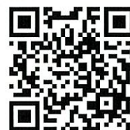
申込フォーム QR コード

先着順とさせていただきますが、お申込が多数の場合は当方にて ご参加日を調整させていただくことがございます。