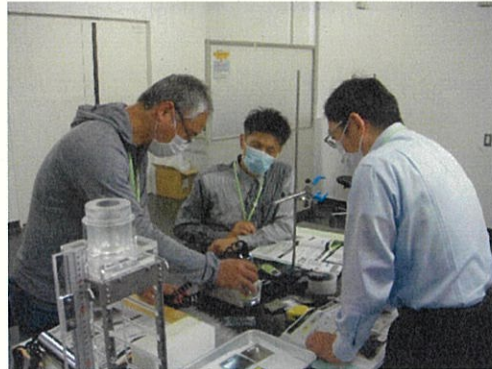
実習「放射線測定器の取り扱い」

現在原子力災害医療に関する研修は、基礎、専門、高度専門へとステップアップする研修体系（以下、「新研修体系」という。）のもと開催いたします。