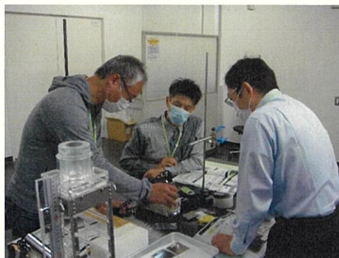
実習「放射線測定器の取り扱い」

現在原子力災害医療に関する研修は、基礎、専門、高度専門へとステップアップする研修体系（以下、「新研修体系」という。）のもと開催いたします。