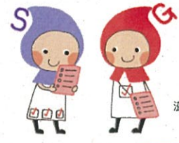
滋賀の健康づくりキャラクター「しがのハグ&クミ」