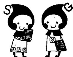
滋賀の健康づくりキャラクター 「しがのハギ&クミ」