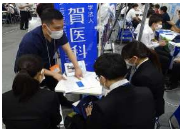
研修医による広報活動