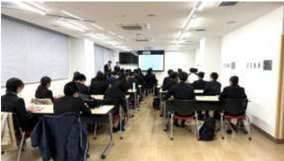
採用オリエンテーション