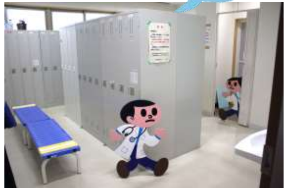
更衣室・シャワー室