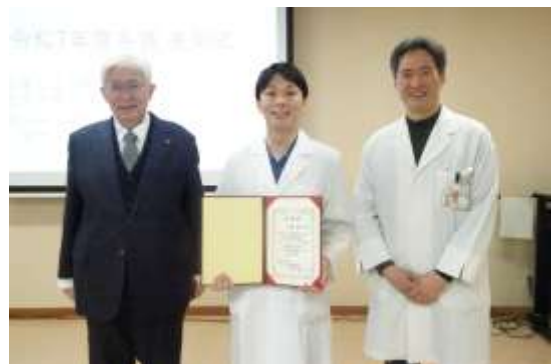
最優秀研修医表彰