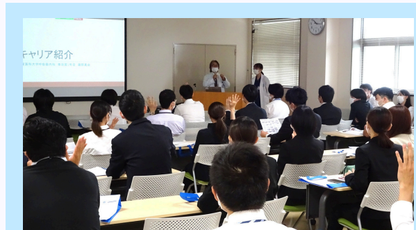
専攻医キャリア説明